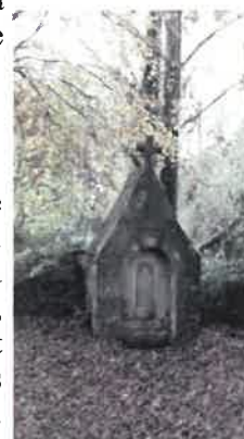
Fontaine Saint Geran de Keresse