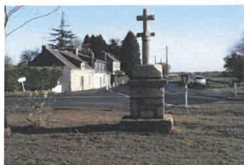
Mise en valeur de la croix de Bolan