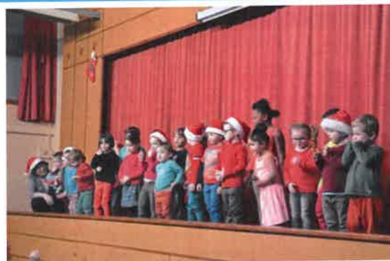
Arbre de Noël