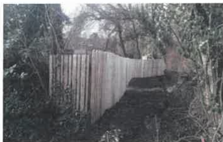
Création d'un brise vue le long du halage à la Lande la Mer afin de ré-ouvrir le sentier de randonnée