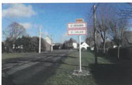
Changement des limites d'agglomération Passage à 50km/h rue du Bel Air et Route du Canal