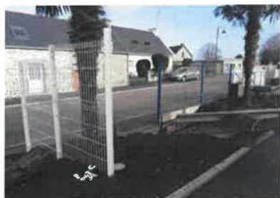
Création d'un portail au 25 rue des écoles