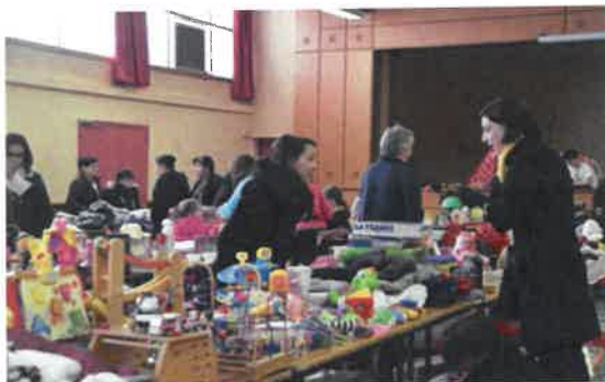
Troc et puces enfant et puériculture